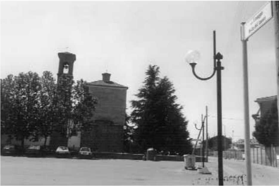
Piazzale I Maggio.