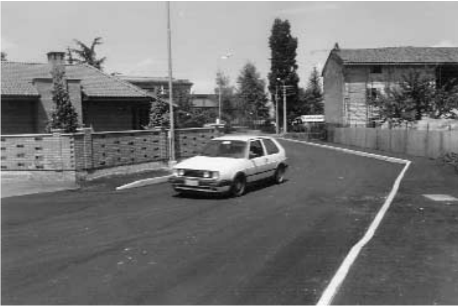
Via Madre Teresa di Calcutta.