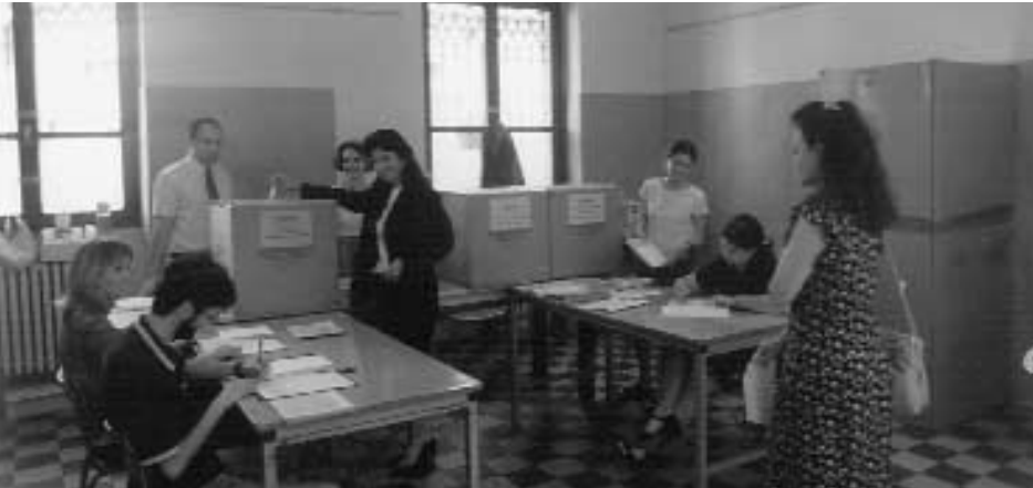
Operazioni di voto.