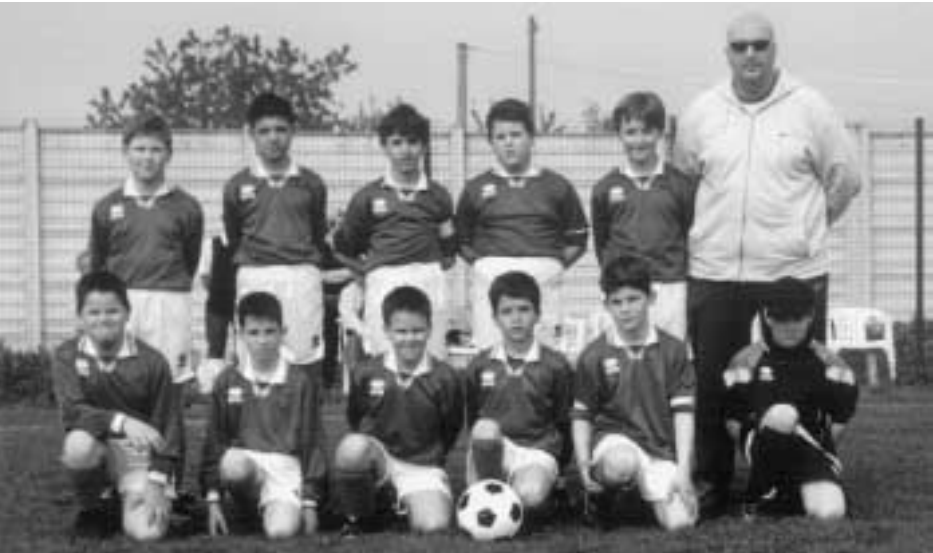
Una formazione del settore giovanile di calcio casalcermellese.