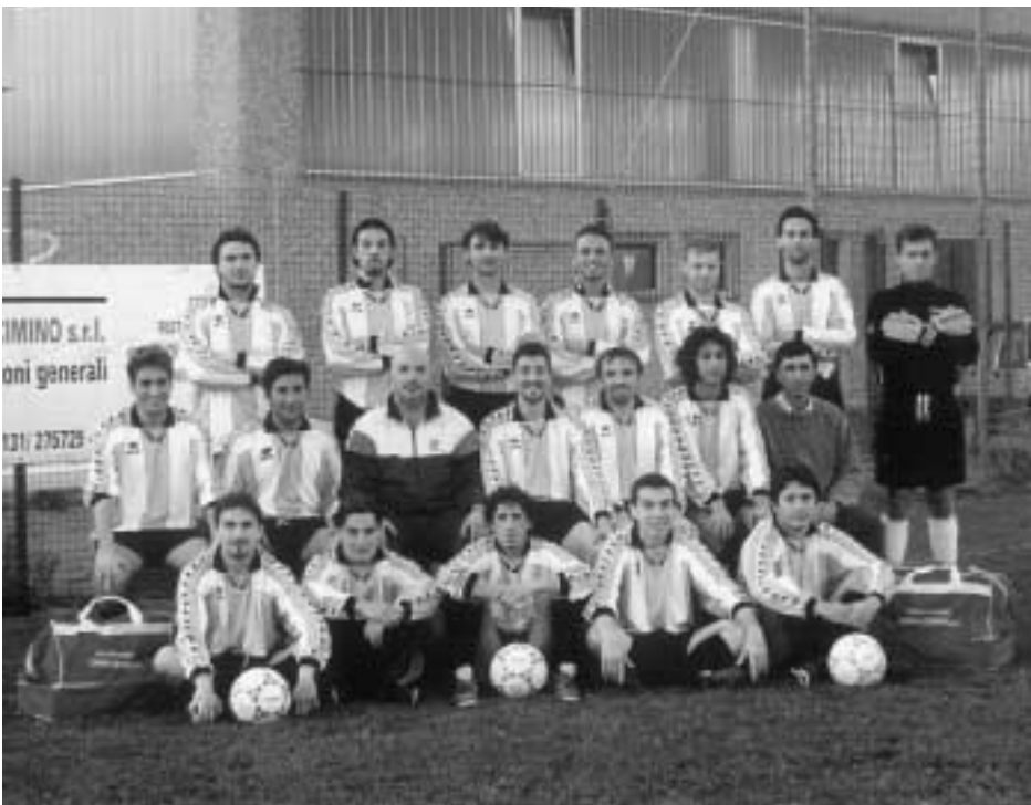
La squadra della Polisportiva Casalcermellese.