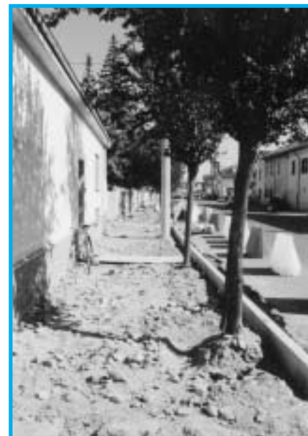
Spalto Montebello, rifacimento marciapiedi e lavori vari

Infine, è prossimo al termine, la pulizia da arbusti, alberi e rifiuti, ingombranti